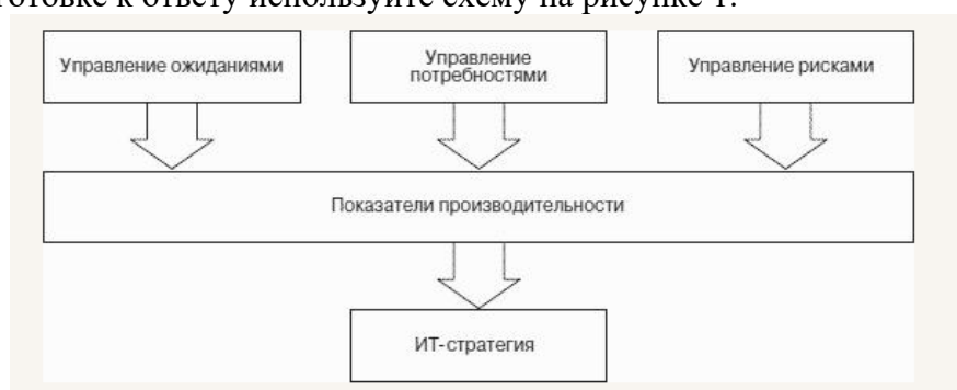
Рисунок 1 – Составляющие ИТ-стратегии

Задача 1. Цели ИТ-стратегии современного предприятия (организации) и решаемые задачи? При подготовке к ответу используйте схему на рисунке 1.